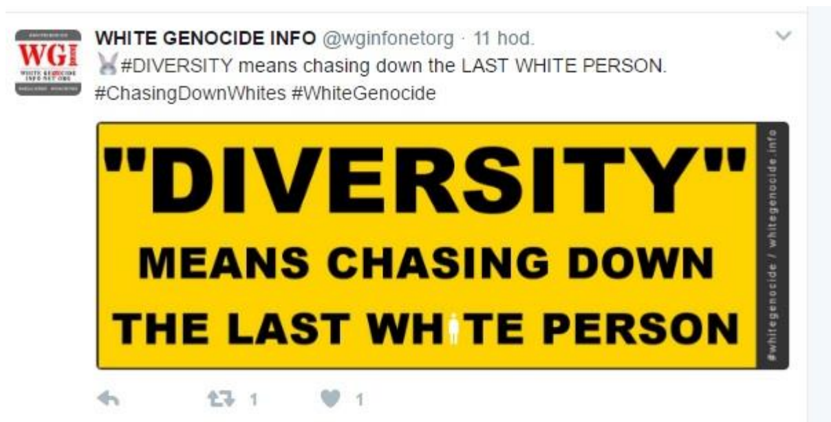
Obrázek č. 6.