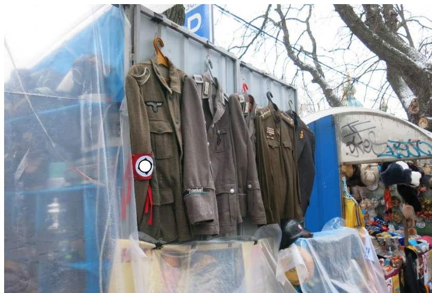
Obr. 2, Německé fašistické uniformy v kyjevském stánku se suvenýry

s takovýmito excesy, neboť si jen stěží lze představit, že takovéto „suvenýry“ můžeme zakoupit na oficiálních tržištích např. v Berlíně, či Paříži, což jsou města, mezi která by Kyjev patrně rád patřil.