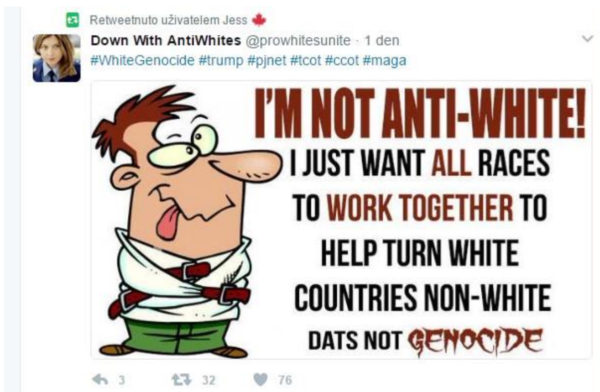
Obrázek č. 7.