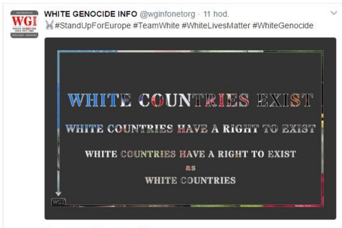
Obrázek č. 4.