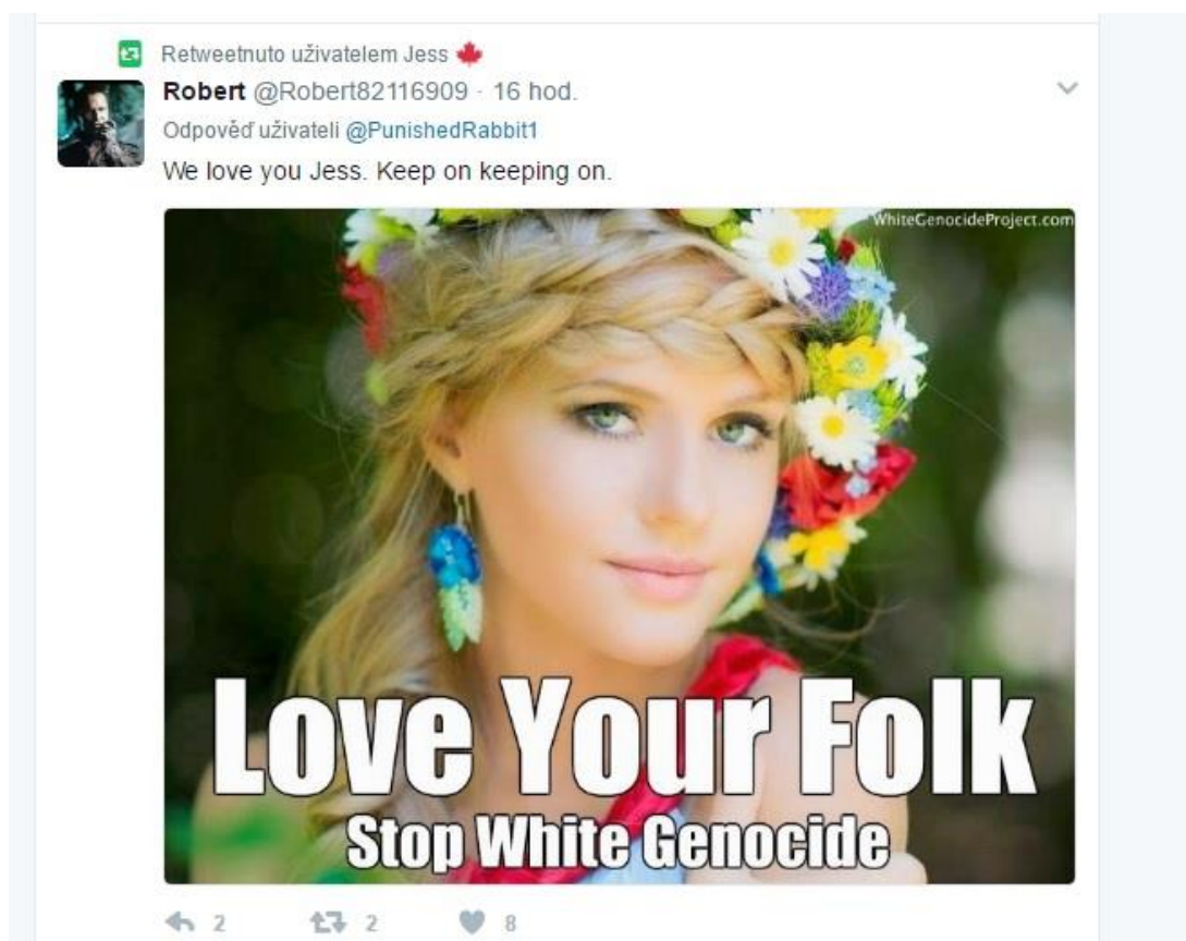
Obrázek č. 8. zdroj – profil Jess – ( https://twitter.com/PunishedRabbit1 ).