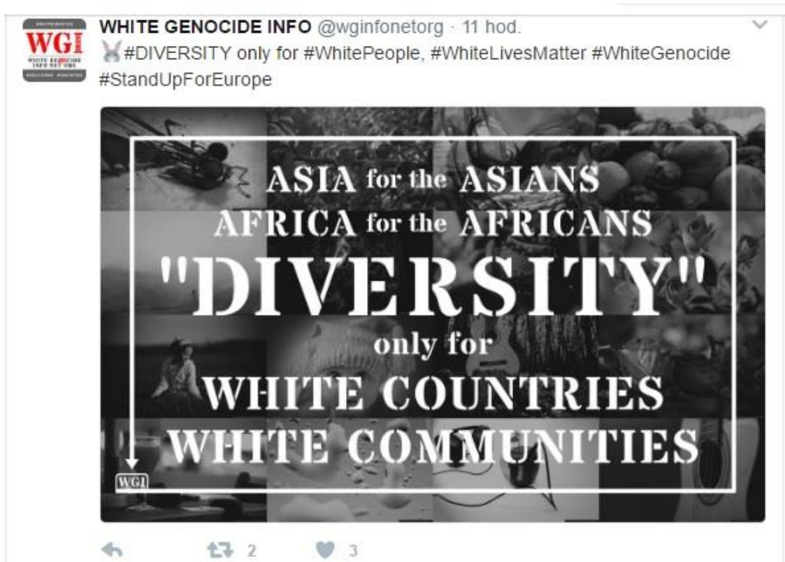
Obrázek č. 5.