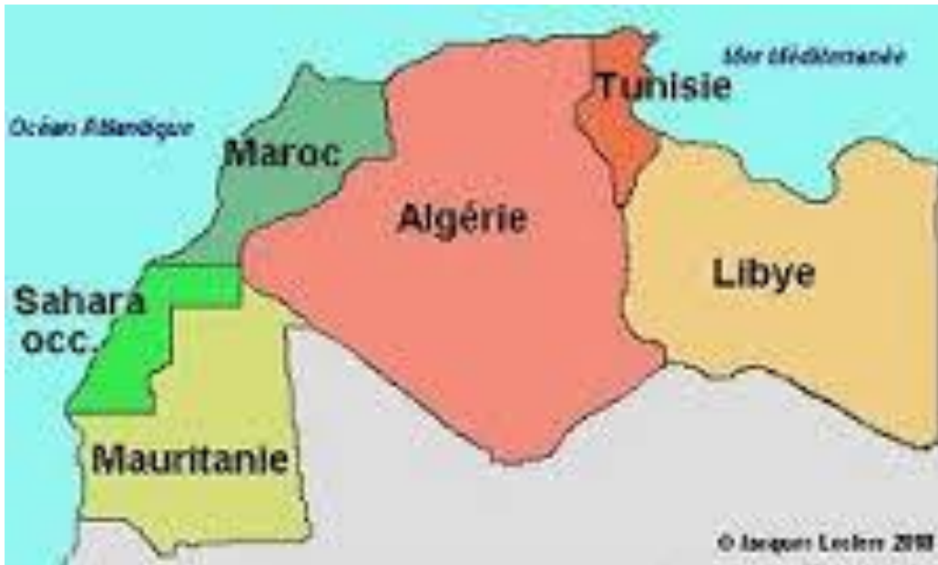
(Obr. 1, Země UMA)