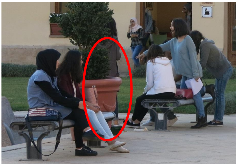
(Obr. 3, Muslimští studenti, Maroko 2015)

Na jižním břehu Středozemního moře se nachází desítky milionů mírumilovných muslimů, kteří jen chtějí žít v důstojných podmínkách a bez strachu o svůj život. Tímto tvrzením však nelze snižovat význam a potřebu bezpečnostních opatření v případě masového přílivu cizinců z jihu. Jde pouze o uvědomění si racionálního postoje vůči nim neboť tvorba nepřátelských předsudků vůči přistěhovalcům povede pouze k jejich horší socializaci do evropské společnosti, jejich separaci a snazší radikalizaci. Rovněž vliv Západem podporovaného Arabského jara a jeho ničivých následků vůči některým arabským zemím lze považovat za rovněž zásadní bezpečnostní otázku. Ta je však natolik závažná, že by potřebovala vlastní rozsáhlý výzkum.